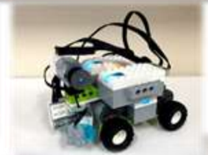
救助ロボと動作プログラム