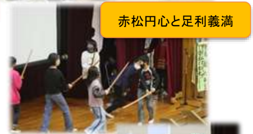
赤松円心と足利義満