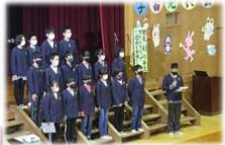
6年生の発表のようす