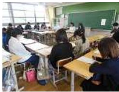
4月27日の参観日・学級懇談会・PTA総会には、PTAの皆さん、保護者の皆様、多くの皆様にご参加いただき、ありがとうございました。

4月27日の参観日・学級懇談会・PTA総会には、PTAの皆さん、保護者の皆様、多くの皆様にご参加いただき、ありがとうございました。参観授業では、意欲的に学ぶ生徒の姿がご覧いただけただけでなく、席を離れての参観も、PTA総会では30年度の報告と平成31年度（令和元年度）の活動案が承認されました。次回参観日は、6月13日です。